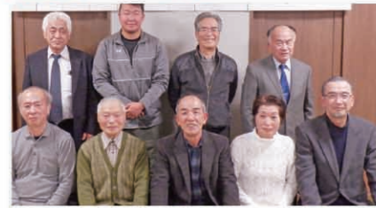
平泉黄金メロン 生産者の方々